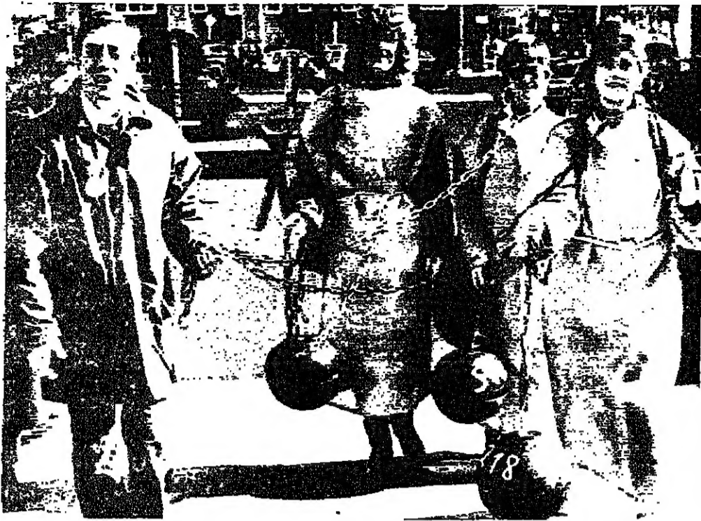
ارادت ثلاث نساء من اللبانيا الاتحادية ملابس السجيات وحملن كرات حديدية ورحن يتظاهرن في ٢٥ الجاري ضد مضمون البند رقم ٢١٨ المتعلق بالاجهاض في مينيون - ر